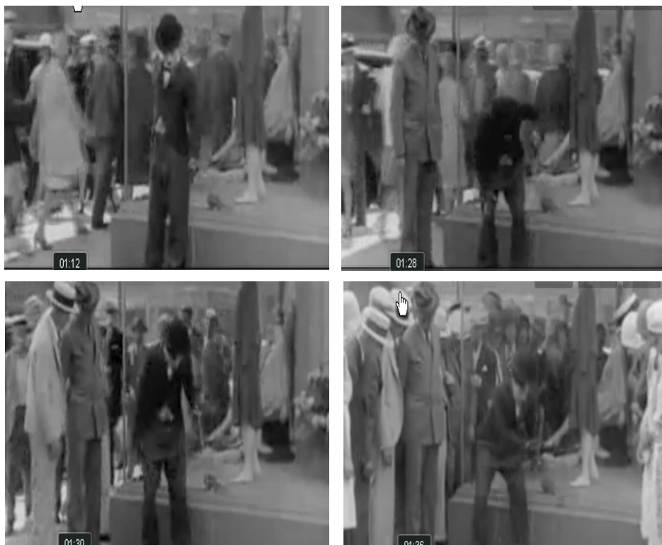
FIGURA 2 DESARROLLO CINEMATOGRAFICO DE LA ESPECTACULARIDAD

La vertiente especular queda de manifiesto ahí donde se halla reciprocidad entre los espectadores que ven una misma función representada: yo soy espectador de la función que otros expectantes pretenden ver y, viceversa, otros son espectadores de la función en la que yo soy un expectante más. Adviértase ahora que esa relación especular es recíproca y reflexiva a la vez, de manera que es la expectación de la función representada la que queda incluida en la función donde yo aparezco como expectante y, viceversa, mi expectación queda incluida en la función donde otros aparecen como espectadores.